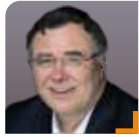
M. Patrick Pouyanné Président-directeur général

Administrateurs en fonction au 18 mars 2026