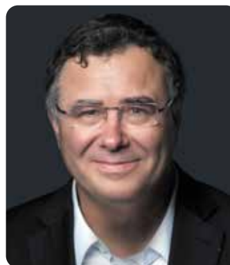
Patrick POUYANNÉ Président-directeur général

En 2025, dans un contexte marqué par un repli des prix du pétrole, TotalEnergies a tiré les bénéfices de sa stratégie multi-énergies intégrée et équilibrée conciliant croissance rentable et développement durable en étant pour la quatrième année consécutive, la major la plus rentable avec un ROACE (1) de 12,6%, tout en étant celle qui investit le plus dans la transition énergétique avec près de 3,5 milliards de dollars investis en 2025 dans les énergies bas carbone, dont près de 3 milliards dans l'électricité.